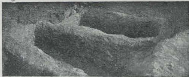
Fig. 612. — Necròpolis de Can Prats (Eivissa). Sepultures

d'or. A l'anell hi mancava la pedra, mes les arrecades estaven en molt bon estat de conservació; el dibuix és format per un rossetó de planxa d'or arrugat amb una perla de vidre verd al mig (fig. 613).