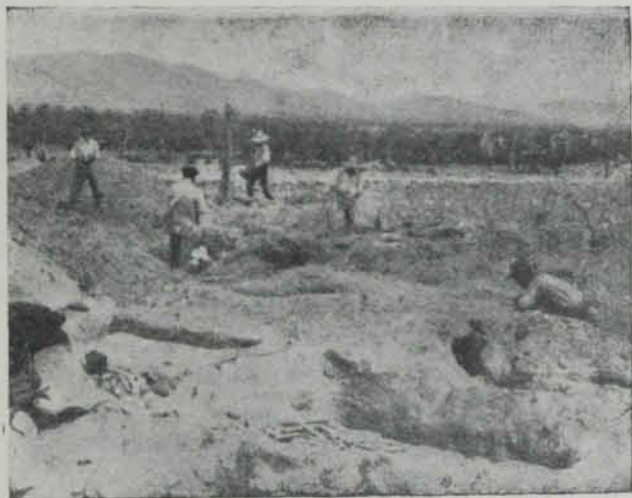
Fig. 610. — Eivissa. Necròpolis de Can Flit

Creient que fent una excavació metòdica, amb cura de recollir tots els objectes de cada sepulcre per separat, les monedes podrien datar-nos una gran quantitat de ceràmica que allavors tan sols sabíem que era romana, però no la data fixa, excavàrem una necròpolis a Can Flit i unes sepultures a Can Prats.