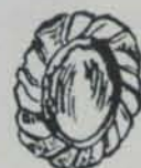
Fig. 613. — Necròpolis de Can Prats (Eivissa). Arrecades d'or (1/1)